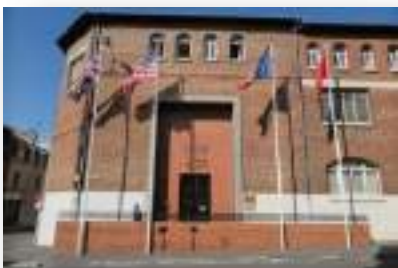
Musée de la Reddition