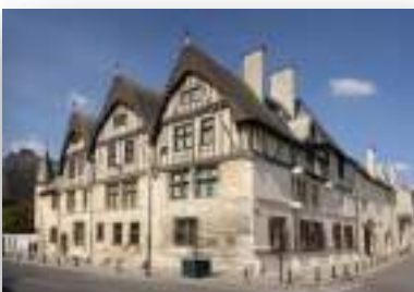
Musée Le Vergeur