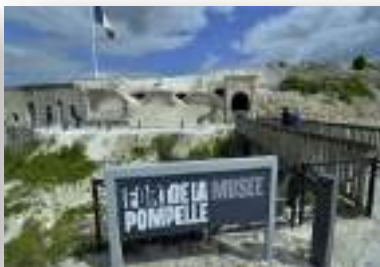
Fort de la Pompelle