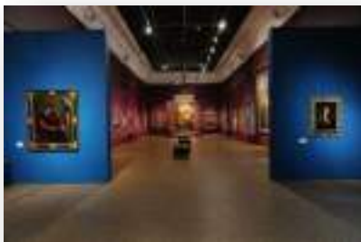
Musée des Beaux-Arts